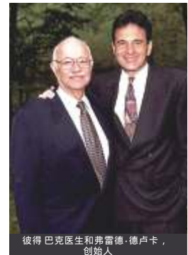
彼得·巴克医生和弗雷德·德卢卡， 创始人

注意：由于我们每周都收到1,000 多份宣传册，所以希望您填好随附的申请表，让我们了解您的兴趣所在。收到后，我们将给您寄一份发行文件，里面是关于赛百味特许经营的详细信息。您也可以在线申请，网址是： www.subway.com.cn