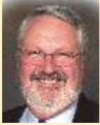
保尔 黑斯- 英国

赛百味系统正在全球范围内寻找发展代理商以便帮助我们实现自己的梦想，完成自己的使命，并利用赛百味的理念在特许经营行业取得成功。