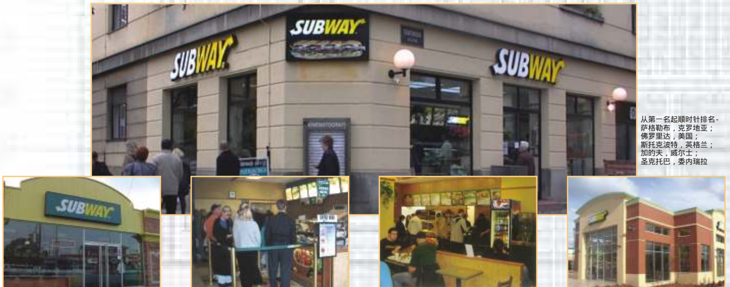
从第一名起顺时针排名- 萨格勒布，克罗地亚； 佛罗里达，美国； 斯托克波特，英格兰； 加的夫，威尔士； 圣克托巴，委内瑞拉